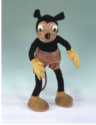
Mickey Mouse toy made by Dean's, English, 1930's (velvet)

Bu indeks, yeşil yaprakların Aztek hükümdarlığından, 1930'ların Mickey Mouse bez oyuncasına uzanan geniş çapta kültür ve periyotları içermektedir. Bir müzik enstrümanı, askeri malzeme, saat resimleri gibi farklı görüntü içeriklerinin hepsine Bridgeman Sanat Kütüphanesi'nden erişim sağlayabilirsiniz.