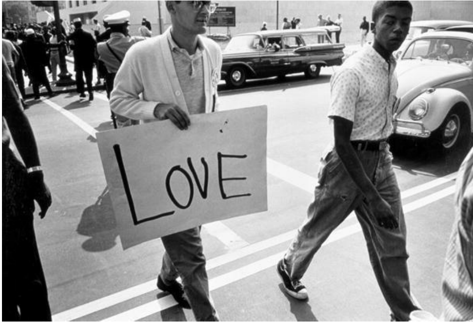
The March on Washington: Love, 28th August 1963 (b/w photo) Herz, Nat (1920-64) ©Bridgeman Education

İhtiyaç duyduğunuz ve burada olmayan konularla ilgili lütfen bizi bilgilendiriniz, eklenmesini istediğiniz indeks oluşturulması için talebiniz değerlendirmeye alınacaktır.