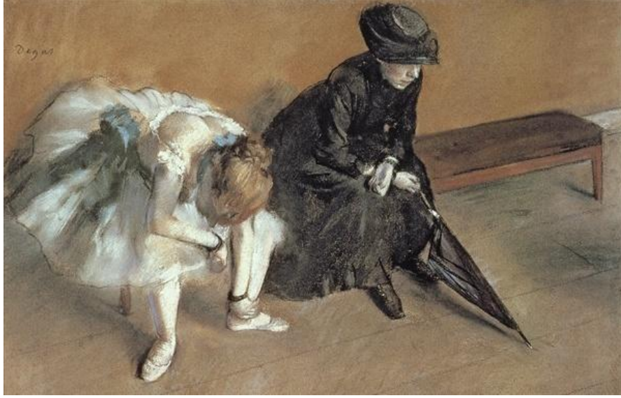
Waiting, c.1882 (pastel)

Bu indeks ile sanat tarihi ile ilgilenen arařtırmacılar için geleneksel sanat tarihi referans terimlerinin aranması saęlanmaktadır.