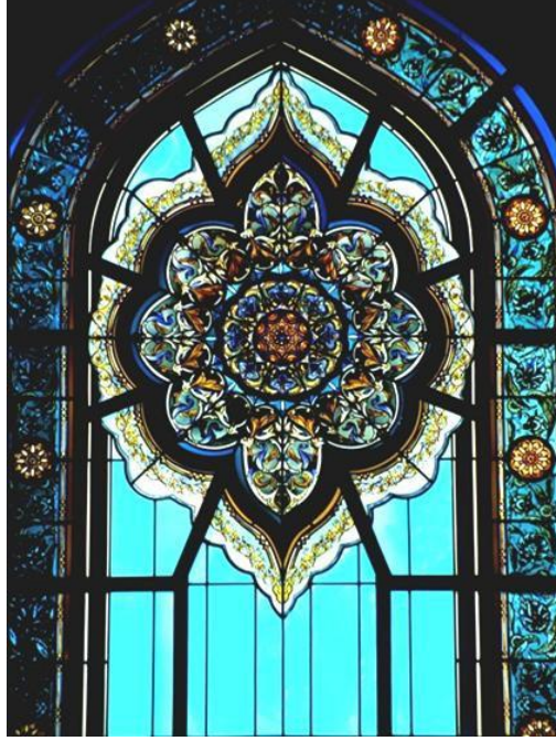
Window in the mosque (stained glass) , Islamic School, (20th century) Sultan Qaboos Grand Mosque, Muscat, Oman, ©Bridgeman Education

Bu indeks; tablo, resim, kanvas üzerine yağlı boya gibi çok farklı görüntü içeriklerini kapsamaktadır. El yazmaları, seramik ve heykeltıraşlık gibi uygulamalı sanatlar aşağıda listelenmektedir.