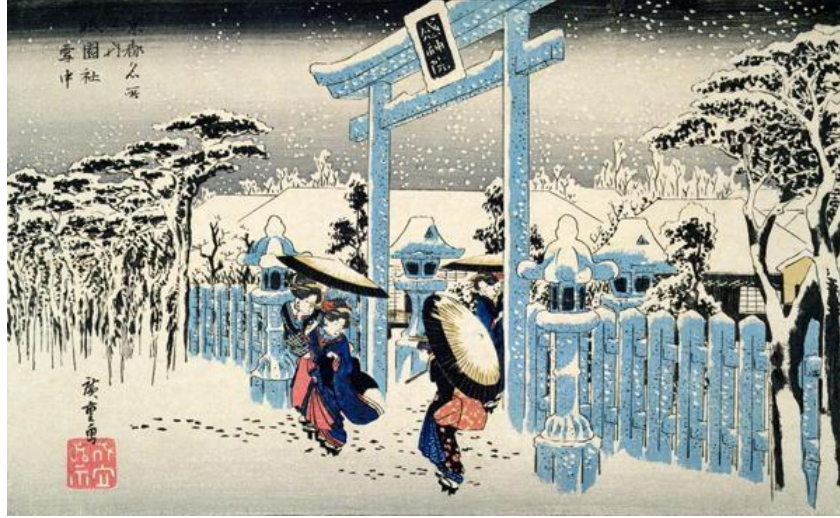
Snow at night: young women leave a temple in heavy falling snow, from the series '53 Stations of Hiroshige, Ando or Utagawa (1797-1858)

Jomon Periyot içerisinde MÖ 14.000'den günümüze uzanan görüntü içerikleri yüzyıllar süresince Japon sanatından örnekler yansıtmaktadır.