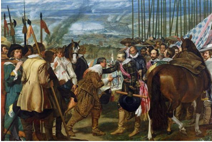
The Surrender of Breda, 1625, c.1635 (oil on canvas) Velazquez, Diego Rodriguez de Silva y (1599-1660)

Bu indeks ile Bridgeman koleksiyonu konularına göre incelenebilmektedir. Her konu çok geniş alanda bilgilere yer veren alt konu başlıklarına ayrılmıştır – Etnografya'dan Kongo'da kullanılan Kwele maskesine – edebiyat ve dramada dünya çapında karakterler, sahneler ve popüler kitap ve oyunlara kadar uzanan çok çeşitli konu alanlarında görüntü içeriklerine erişim sunulmaktadır. Bu bölüm aynı zamanda tarih içinde yer alan tüm kıtalar ve uygarlıklara ilişkin savaşlar ve tarihi olayları içermektedir.