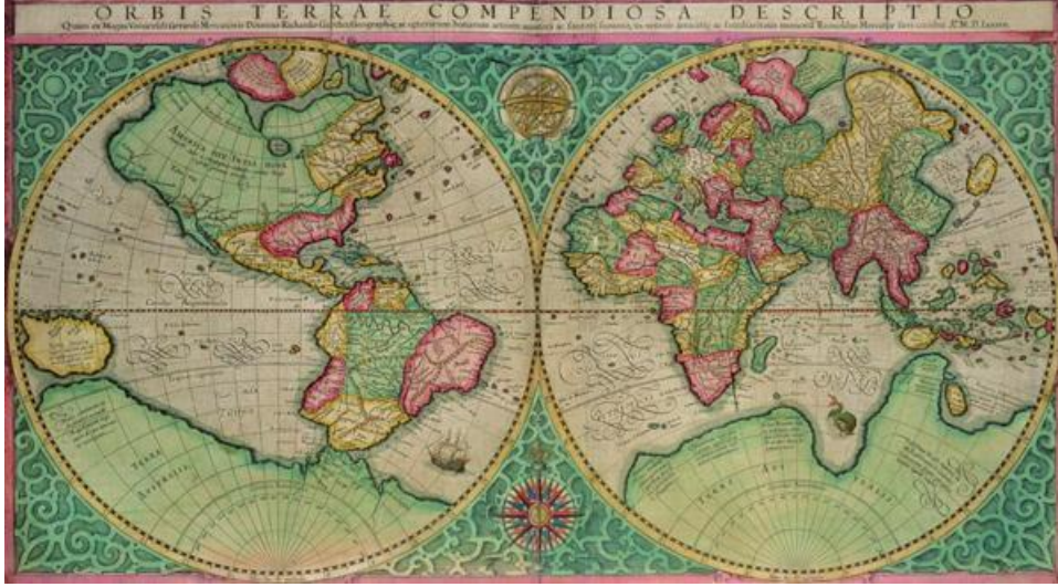
Map of the world, from the 'Atlas sive cosmographicae..' published 1595 (coloured engraving) Mercator, Gerard (1512-94)

37 yıldan fazla süredir araştırmacılar tarafından kullanılmakta olan Bridgeman Art Library; (Bridgeman Sanat Kütüphanesi) insan ve mekanlar, kölelik, toplum, din ve spor gibi geniş kapsamlı konu içerikleri içinde tarama yapmak için oldukça etkin bir kaynaktır.