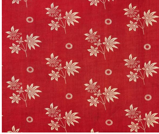
Lining of abr ikat munisak, late nineteenth-early twentieth century (roller-printed cotton cloth) Russian School

Grafik tasarımı öğrencilerinin katılımı ile oluşturulan bu indeks ilham kaynağı olabilecek ya da dizayn çalışmaları için taslak olarak kullanılacak içinde meşhur tasarımlar ve ikonik kalıpların bulunduğu görüntü içeriklerini sunmaktadır.