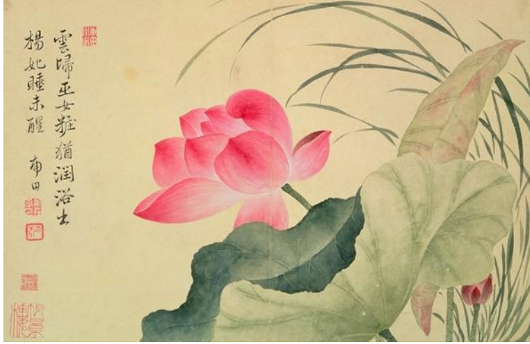
Lotus flower, by Yun Shou-P'ing (1633-90), from an 'Album of Flowers', (w/c on silk backed paper) Yun Shouping (1633-90)

Bu henüz oluşturulmuş konu kategorisi, geçmiş yüzyıllardan günümüze Çin ve hanedanlıkları ile ilgili tutarlı ve kapsamlı görsel içerikleri erişime sunmaktadır.